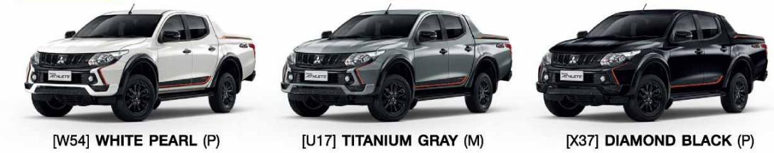
[W54] WHITE PEARL (P) [U17] TITANIUM GRAY (M) [X37] DIAMOND BLACK (P)