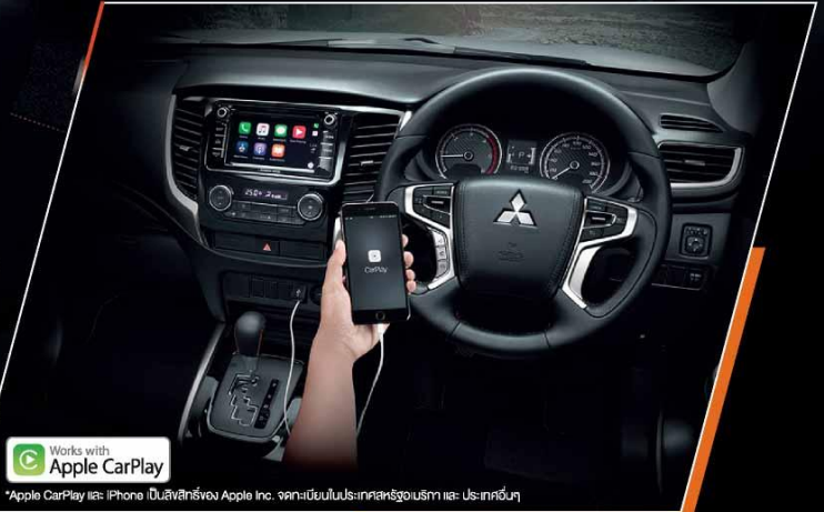
*ภาพจากห้องโดยสารรุ่น Double Cab ATHLETE 4WD

เกียร์ธรรมดา 6 สปีด พร้อมหัวเกียร์หุ้มหนังตกแต่งด้วยสีส้ม *เฉพาะรุ่น Double Cab Plus ATHLETE 2WD MT และ Mega Cab Plus ATHLETE เท่านั้น